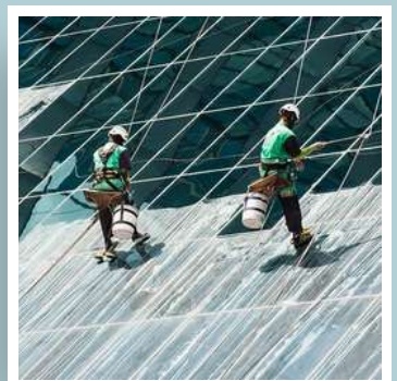
Servicios para empresas