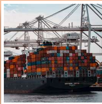
Importadora y Exportada