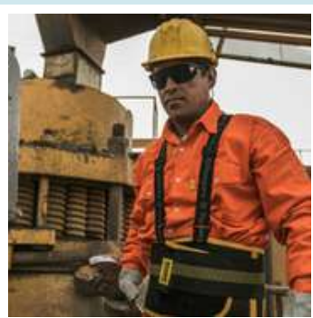
Indumentaria y Calzado